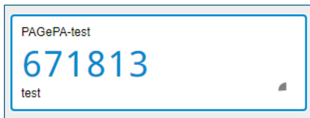
Esempio di pin a 6 cifre da utilizzare per PAGEPA

Questo codice deve essere inserito nel campo in basso nella maschera sopra il pulsante “Accedi”.